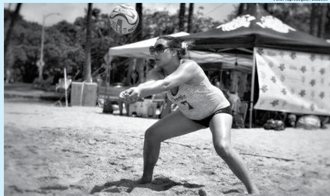
As organizações mundiais de esportes estão ainda em processo para atualização de regras para casos semelhantes ao de Tia Thompson, herdeira do

Recentemente, Sabine Kehm, porta-voz da família de Schumi, disse que o estado de saúde do ex-piloto é assunto privado e pediu que os fãs ajudassem e respeitassem o direito de manter sigilo absoluto. "So assim poderemos transformar um evento trágico, que afeta toda a família Schumacher, em algo positivo", explicou a assessora.